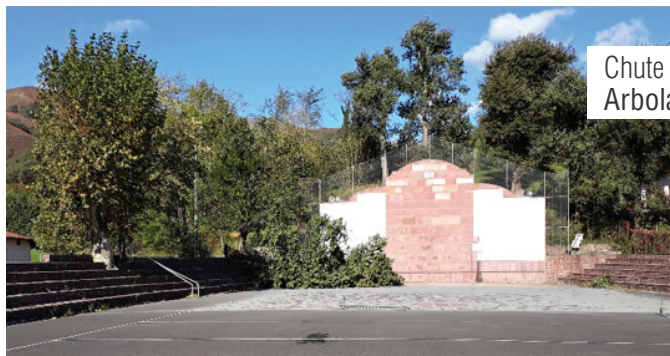
Chute d'un arbre lors de la tempête de l'automne dernier Arbola bat erori zen joan den larrazkeneko ekaitzaren ondorioz

L'objectif est de prévenir tout risque de chute. Le bilan complet établi a porté sur l'état physiologique, mécanique et ontogénétique (stade de développement de l'arbre). Sur les 105 arbres diagnostiqués, 67 sont en bon état et ont fait l'objet de préconisations d'entretien spécifique, 13 ont nécessité un entretien régénérateur. Les 25 autres arbres, trop malades pour être conservés, seront abattus par sécurité et systématiquement replantés.