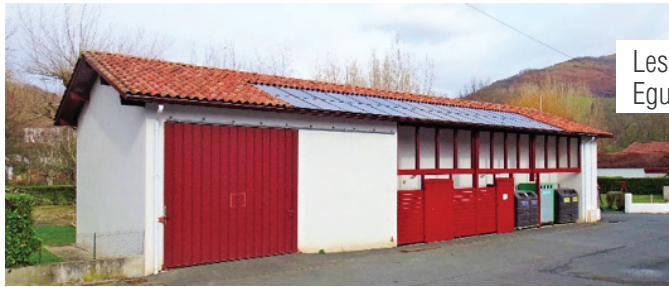
Les panneaux solaires sur le toit du camping Eguzki panelak akanpalekuko teilatuan

Le secteur du complexe sportif fera également l'objet d'une étude d'opportunité de réseau de chaleur/chaufferie Bois.